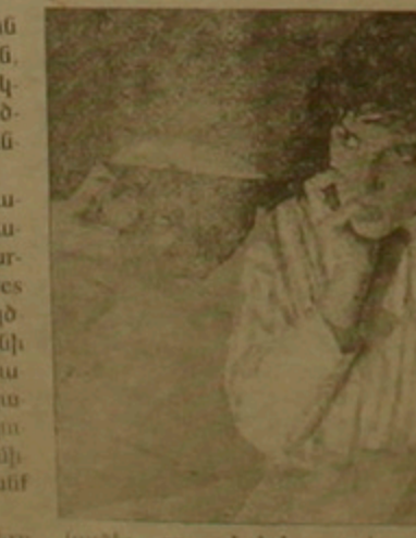
կանել, որ «ստեղծի դասարարութուն» կանգնել է դասարարիկ կոսկանակութունութուն վիճակին: