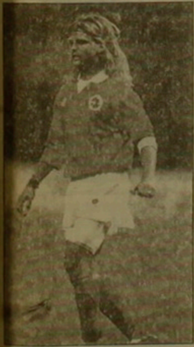
Շվեյցարիայի հավաքականի կապիտան Ալան Սուեդեր

Մասուրանա (Կոլումբիայի հավաքականի ավագ մարզիչ) «Ինչ որ տուր մեր դարձրությունը ցնցող էր։ Սակայն մեր թիմը միասնական է և դժվարություններ կհաղթահարեն։ ԱՄՆ-ի դեմ արդեն անհրաժեշտ կարգադրություններն արել ենք։ Մի քանի օր անց կենք Կոլումբիայի նախագահի դերերը»։