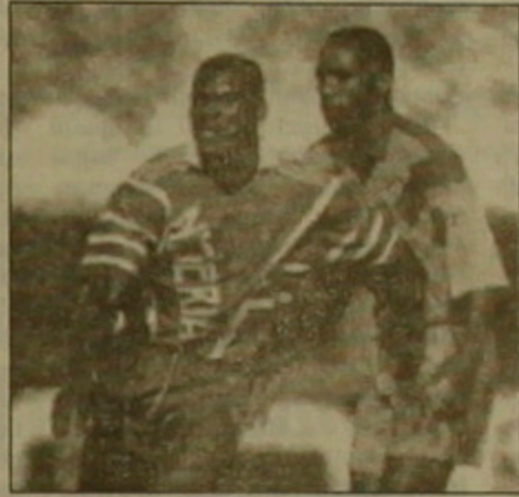
որը չի ժամանել ԱՄՆ:

ին: Աշխարհի առաջնության կազմակերպիչներն անհամբեր սպասում է քիմի ժամանելուն: ՖԻՖԱ-ի ներկայացուցիչ Անդրեաս Հերթն նույնպես հաստատել է, որ Նիգերիայի հավաքականի ռեպրեզենտատիվները կապված է միայն մոսֆի այցագրերի հետ: Իր հերթին աշխարհի առաջնության կազմակերպիչները կներկայացուցին ավելացրել է, որ որոշ այցագրեր ճիշտ չլին ձեռնարկված, որի դրսևանով բոլորը հետաձգվեց: Այնուամենայնիվ, սպասվում է, որ վաղը առավոտյան աֆրիկացի ֆուտբոլիստները կժամանեն ԱՄՆ: Չնայած քիմերիկների ներմուծման դրսևանով Նիգերիայից բոլորներն ԱՄՆ խիստ սահմանափակ են եւ արդեն սրտառու, այնուամենայնիվ Միացյալ Նահանգների կառավարությունը բոլոր է սկզբից թոյլ կազմակերպել Նիգերիայի մայրաքաղաք Լագոսից, որը քիմերիկների առաջնական կենտրոններից մեկն է: