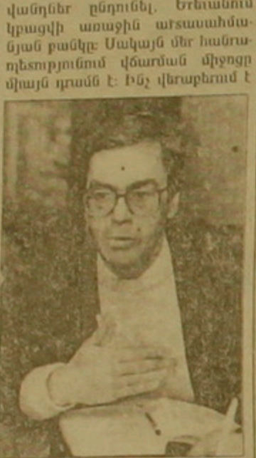
Քաղցրաս Ասասյան: ԱՄՆԱՆՆԵՐ

ՍՄԻՐԱՆ ԲԱՐՍԵՆՅԱՆ ԵՐԵՎԱՆ, 21 ՀՈՒՆՎԱՐ, ԱՐՄԵՆ- ՊԵՏ: «Մեր հասարակարգում բանկը նոր երևույթ է, որը դեռ է ենթակալի այն իրական դասակարգ- ներին, որ այսօր ամաչադրվում են և ունենա իր հսակ սեղը որդես կառավարման որոշակի օղակ», ե- րևի լրագրողների հետ հանդիպման ժամանակ ասաց ՀՀ Կենտրոնա- կան բանկի նախագահ Քաղցրաս Ա- սասյանը: Եւ որդես եզրակացու- թյուն նա ասաց, որ ըստ էության, մենք չենք ունեցել իսկական բան- կային համակարգ: Մասնով մե- կայացուցիչներին հավաստագն- յով, որ կունենան ծրագրերի և ան- վիճելի մասին կարող է նրանց հետ զրուցել ամսվա 100 օր հետո, ինչը ընդունված է ԵԱՍ Երկրներում, ՀՀ Կենտրոնական բանկի նախագահն այնուամենայնիվ նշեց, որ ինքն ձեռնամուխ են եղել դրամավարկ- ային հաղահաղանորդյան եւ այլ կա- րեւորագույն հարցերի մշակմանը: Գերագույն խորհրդին է ներկայաց- վել դրամաբարձարության մասին փոփոխությունների ծրագիր: