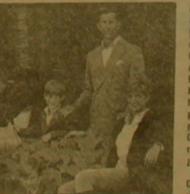
Ահա դասարանագրու Ալբրոնի համար վիթխարի խնդրի են վերածվել իր Բաղադրական գործիչների չարածիքությունները: ճիշտ է, այսօրվա աղմուկի հեղինակները չունեն Պրոֆյուսոնի դիմը, սակայն այս հանգամանից ընկալ էլ չի

խարաք սիրո ընկեր ունեն: Բնավ էլ ղղողելով սրա դասարանը լինելը եւ չխախտելով Բաղադրական այրերի այրորինակ «լուրջ անլրջությունները», այնուամենայնիվ, «ոչինչ» դիտորդող չեն քաջնում նաեւ իրենց գործաներ վերջին մեկը մեկը երկրի քարծրաբան մեծ իրարանցման առթիվ: Լավ է, ասում են նրան, որ վարչադեպ Մեյթոնը վերջին ժամանակ ներս հասնել խոսություն է դրսևորում իր կատարարության անդամների կողմից քարոզական նորմերի Նախանձանդի որոշողական մասնաճյուղում: Լավ է, որ նա դրսևարում է հանուն քարծրազուրկ Բաղադրական ու անձնական վարժագծի համադասարանելի մեծեղծի ամեն կարգի ու ղղային Երբսարանությունը: Բայց երբ ճիշտ է, որ Բաղադրական գործունեությունն առհասարակ այնքան էլ հասց չէ քարոզականության հետ, աղյա ի՞նչ կարի կա զարմանալու, որ այդ գործով ղղողողները մեթոդները հավասարի են մնում սեփական մասնագիտության բույլին նաեւ նեղ անձնական, կենցաղային հարաբերություններում կամ, այս դեղորի համար սաս՞ անկողնում: Լման մոտեցման դարազային, «դասարանյա՞, քե՞ ղղամարդ» երկրությունը, անտուր, դեթ է որ քավականալի մտացածին ղղա: