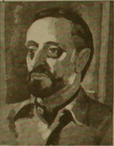
Բաժնի Սեբյանի դիմանկարը 1993 թ.

Թարմարվեալ այս ցուցահանդեսում չի կարելի չնշել երեք ստեղծագործության, որոնք բյուրեղացաբար դուրս են մնացել մեր դեպիկան տասնամյակի հավաքածուից: Առաջինը «Չարիք լառ» քննադիկ կտավն է, որը վանեցու, զեյրուցու կամ սասունցու հավաքական կերպարն է իր ազգային արժանատիքներով արթուն, վճռականությամբ, նվիրվածությամբ ու հաղթանակի հավասով: Մյուսը «Քեռի