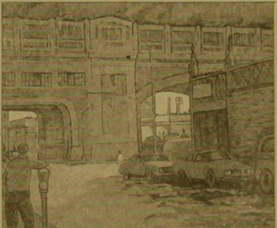
Սփանն Դոնիկյան. «Իրազդ փողոցի կանգառ», 1990

«...Մեր հայրենիքի այժմուայ անմիջաքար վիճակն էլ միս կողմից հոգիս է ճեճում: Սեւ փող սիրողի մայրնութիւն է զարգանում մեր ժողովրդի մէջ, անվերջ մուրալ ենք սկսել, աղերսել, լացել, զանգասել, յուսահատել ենք, յուսալարուած ենք, քայքայուողներ չկան ոչ մի կողմուն, սա փորձանք է մի ազգի, մի ժողովրդի համար: Արեւո՛ր չոյիսի մի քան աննք ժողովուրդի հոգեկան անկուտը Եանելու ուղղութեանք»: