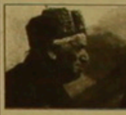
Աղբիլի 13-ին Սուկվայում վախճանվեց ակադեմիկոս զեհարյանը, ակադեմիկոս