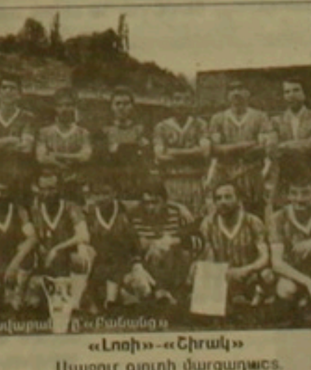
«Լոռի»-«Շիրակ» Այսօր գուղի մարզաղաբարուլ: «Կայեն» (Իջեւան)-«Իմողղուս»

Այսօր հանրադեմոստրյան 6 քաղաքներում մեկնարկում է Հայաստանի Հանրադեմոստրյան ֆուտբոլի գավաթի երկրորդ խաղալությունը: Մեն հայտնել էին, որ Կոսայի քրանի «Քանակ»-ը, որոնք անցալ տարի գավաթակիր, մրցաաղին կնեբրալվի 1/8-րդ եղալալից: