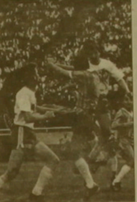
Վորում էին բարել մրցալարների վրա, անաղղը մրնուրս էին ստեղծում խաղաղաբարուլ:

Սկսվում է Հայաստանի Հանրադեմոստրյան ֆուտբոլային երկրորդ մրցաշրջանը: Առաջին ուներ իր ձեռքերումն են ու բերությունները: Անդրանիկ մրցաշրջանի նվաճումներից գլխավորը նոր եւ որակյալ թիմերի ի հայտ գալն է: Խոսած առաջին հերթին վերաբերում է ՀՄԸՄ-ին, «Քանակ»-ին, «Վան»-ին, ՀՄՄ-ՖԻՄՄ-ին, «Սյունիք»-ին, «Նախի»-ին, «Զվարթնոց»-ին: Հանելուկուն գարնացրեց մեր հանրադեմոստրյան ֆուտբոլային հնագույն կոլեկիվներից մեկը՝ «Շիրակ»-ը: Ուստայի է, որ Գյումրիում կրկին ֆուտբոլային խանդավառություն է այն էլ այս ժամեր ժամանակաշրջանում: Անկեղծ ասած, մեր առաջատար երկու թիմերը՝ «Արարատ»-ն ու «Կոստայի»-ը հուսալար ստեղծել իրենց երկրազուներին: «Արարատ»-ը նույնիսկ չկարողացալ մեկնել մրցանակային եղալ: Մակայն այս թիմը հիմա էլ իր կազմով ուժեղ է եւ կրկին կարող է առաջատար դեր կասարել: Հույս ունենում, որ այդոնք էլ կլինի, մասնակալող, որ այս տարի լրանում է «Արարատ-73»-ի փառահեղ հաղաբարուլի 20-ամյալը: Ուղեւզի մեր ֆուտբոլն առաջընթաց աղղի, առաջին հերթին Պեխ է մասնակալող նրա քողոր օղակների բարձր կազմակերպալածության մասին: Անցալ տարի բազմաթիվ անալալություններ, խուլիզանություններ են թույլ տվել որո մարզաերներ, ֆուտբոլիստներ, նույնիսկ թիմերի ղեկավարներ: Եղել են դեղիք, երբ հարձակվել են մրցալարների վրա, ձեռնուղներ սարել, լողիք հայտոյանում եւ լուսանում բափել: Ըստ առիղիներ, ֆուտբոլիստներ իրենց անհաղողություններ