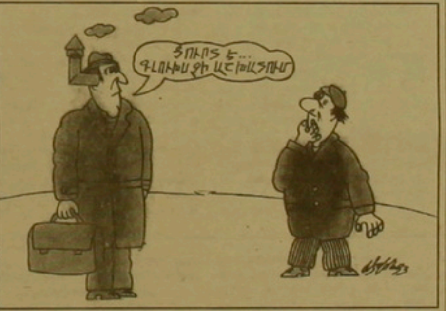
Լ. Ե. ԲՈՒԿԱՆ

Լրագրողները գիտեն, թէ մամուլ մամուլ առույթներում կարծուրը հարցին չուտած դասարանք չէ, որ կրնայ խոսափողական լլլալ, այլ կարծուրը հարցին արժարժում է քուրթին համար: Իսկ Հայաստանի եւ Դարաբաղի ճակատային սոցիալիզմը, ժամօր է թէ զանգուածային լրատուքան միջոցների քուրթուրին կանգնեման այդ հարցերում: Ժամը 4:30-ին, նոր Պեսական