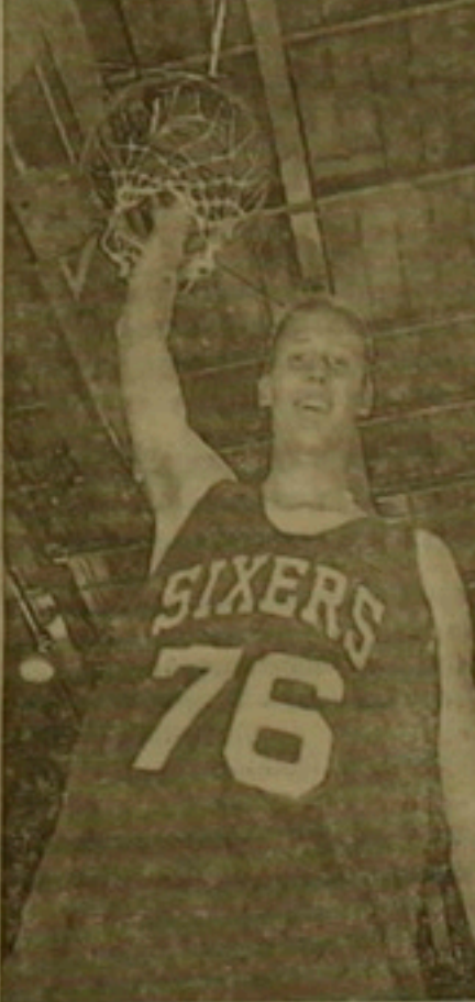
համար Ֆիլադելֆիայի քիմը նույնիսկ մտախոյ է հրավիրել 2 մեծ աստղերի՝ Մոզես Մելնիկին (38 տարեկան) եւ 44-ամյա լեգենդար Արդուլ Ջարրաին, որը դրո՛ժեօնուկ բասկետբոլում անցկացրել է սեկորդային 1560 խաղ եւ վասակել սեկորդային 15837 միավոր, բայց արդեն 5 տարի է ինչ քողել է բասկետբոլը:

Իսկ NBA-ի ամենաբարձրահատկ խաղացող Եռուս Բրեյլին (229 սմ), որն այս տարվանից հանդես է գալու «Սիլվեր» քիմում, 8 տարվա համար 44 միլիոն 200 հազար դոլար է ստանալու: