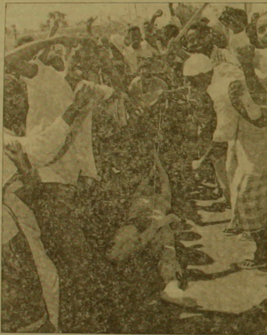
Սոմալցիները փառ են զայն ամերիկացի զինվորի դիակը: