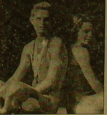
Տալիսական երկրների մարզիկներին եւ ձեւթ բերեն նոր մեղաղներ: «Շազիլ» նույնիսկ Լայդիցի ֆաղուում հիմնել է ֆիզիկական կուլտուրայի հեկազոսական ինստիտուտ, որը մարզիկներին մասնակարարում էր արգելված դեղամիջոցներ:

Գաղսնի տեղեկությունները, որ վերջերս հայտնի դարձան Միացյալ Գերմանիայի կառավարությանը, փաստում են, որ նախկին Արեւելյան Գերմանիայում մարզիկ մարզուկները մարզական արդունները քառելալելու համար օգտագործել են մեծաքանակ արգելված դրոյուններ: Նոր փաստաղրները, որ Բեռլինում հայտնաբերվեցին Արեւելյան Գերմանիայի գաղսնի ոստիկանության (STASI) արխիվներում, վկայում են, որ «Շազիլ» անունով գաղսնի ոստիկանությունն իշխում էր մարզական աղաարում: Գեոեւս 1971 թ. «Շազիլ» սկսեց կառավարել Արեւելյան Գերմանիայի մարզական աղաարը, որոքսզի մարզիկները հաղրող տարի իրենց բեւանի Արեւելյան Գերմանիայում, Մյունխենում կայանալիլ օլիմպիական խաղերում հաղթեւ կաղի: