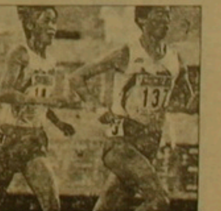
Չինական ֆեռոնեմ, որը ցնցել է մարզապահը

77 քաղաքացի խմբի 2-րդ աստիճանությունում 17-րդ աստիճանում 3117-ում անցման ժամանակաշրջանի խորհուրդը հիմնելու որոշումը, ինչպես նաև այդ երկրում ընտրությունների անցկացման օրվան վերաբերող որոշումը: