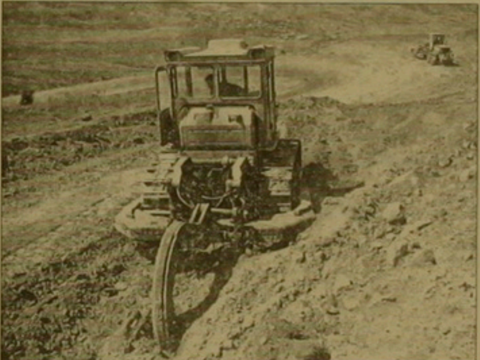
Ճանադարհի են ենթակվում: Ֆինանսավորում իր ներկայացուցիչներն ունի Լեոնային Ղարաբաղում, Չանգեզուրում և Աղեփ գոտում:

Մեր ճանադարհորդության առաջին հանգրվանը Վայքի երջանակն էր, մասնավորապես Վայք-Մարտունի երջանակի ճանադարհը, որը քույր կա մեծացնել սեղանասի բողոնակությունը, մեղմացնել ոլորանները և դասադարձի անվանագույրությունը ձևափոխելից: Բացի դրանից, մայրուղու երկայնով կառուցվում են ձևափոխող դասադարձի անվանագույրություն, որոնք ֆինանսավորումն իրականացնում է «Հայաստան» հիմնադրամը: