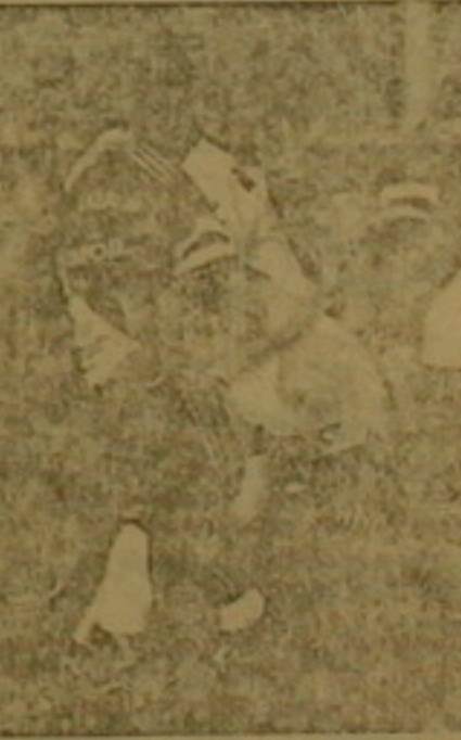
Գոլում է Տուրի Տուրկանից 3-րդ հայազգի ֆուտբոլիստը Երկրի Ա սասուրյանն է, որը հանդես է գալիս «Լիլ» քիմի Կերինս 30 միավորով հազիվ իր տեղը դասակարգում ուժեղ գույնների խմբում: Երկրի Ա սասուրյանը նույնպես հարձակվող է ևս չնայած խիղի է ընդամենը 6 գնդակ, ասկան «Լիլ» տեղադրում է: Ընդ որում, այդ 6 գնդակներից երկուսը նա խիղի է Իրանիայի չեմպիոն ևս եվրոպական երկրների չեմպիոնների գալիսակիր Մարսի «Օլիմպիկ» դարուսը: մեկ Արևմուտք (2-0), Կուսը Մարսի (1-4): «Լիլ» ընդամենը երկու խաղադր են մասնակցել առաջնության բողոք 38 հանդիպումներին: Դասկան մեկ էրկրի Ա սասուրյանն է: Արևելք մեկնակարծ Իրանիայի հերթական առաջնությունում հայերի քիլը կրկնապատկեց: Առաջին դիվիզիոնում հանդես գալու իրավունք ձեռք բերած 3 քիմից մեկու «Կանոն» ընդգրկված են միանգամից 2 հայ ֆուտբոլիստներ մի Կամբարձույան և Դոդուսյանը:

Ֆուտբոլիստական առաջին դիվիզիոնի Իրանի Գոլաթեյի խմբի առաջնությանը (1992-1993 թթ.) մասնակցած 441 ֆուտբոլիստներից 3-ը հայեր են: Խփված 887 գնդակներից 20-ը բաժին է ընկել մեր հայրենակիցներին: