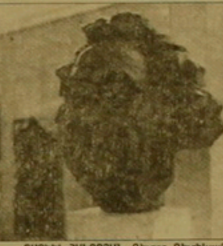
ՏԱՐԻՆԸ ԳԱՐՆԱՅԻՆ Գեղարվեստ

Նոր, քարն արտահայտված էրով այն էն ընկնում ժանրա Մանկայանի «Մտում»-ները, Ալբերտ Խաչատրյանի որմնանկար հիւսիսը «Թաղամար»։ Գրիգոր Գյուլբեյանի «Մեղու-զայի կործանումը» դրամական վերնագրով աշխատանք շեղ-հիվ իր կատարման սեյնիկայի, ստեղծում է ասորյա միջավայրում ներկա գտնվող դասարանը: Թաղետու Տեր-Մարտիրոսի իր «Պատմության քառադրանգով» աշխատանքում աչիս է մեր ժողովրդի դաստիարակ խորհրդանշական դասերը: Զնա-րակներն է համակում Գոհար Թումայանի խճանկարային սկզ-