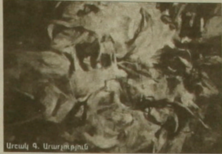
Արալ Գ. Արալյան

Վերջին օրերին մայրաքաղաքի այս ու այն անկյուններում փակցված ազդագրերը ծանուցում էին արաբ օդը բացվելիք «Արալ 9» ցուցահանդեսի մասին: Խոսքը ֆրանսահայ նկարիչ Արալ Գառնիկյանի մասին է, որի գեղարվեստական ժառանգությունն առաջին անգամ դիտարկվեց ներկայացվել հայրենի արվեստասերներին: Բացումը կայացավ Ազգային թատերասրահում, հանդիսավոր դաժմաներում, Հայաստանում Ֆրանսիայի արտակարգ եւ լիազոր դեսպան Մարի Ֆրանս դը Արսենի մասնակցությամբ: Պատկերասրահի սերունդ, արվեստարան Ըստին Խաչատրյանը մասնավորապես նշեց, որ այս ցուցահանդեսը սիրտբախտ արվեստագետների հետ նախատեսվող հանդիպումների շարքի առաջին միջոցառումն է: