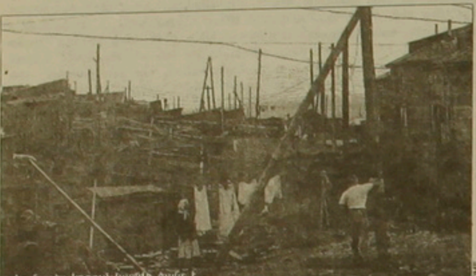
Կունաբեր կղզում կյանքի ծանր է

Ռուսաստանի եւ երկրորդ համաշխարհային պատերազմի ժամանակներից նրա գլխավոր եվրոպական հակառակորդների միջին հարաբերությունները եւ ճապոնիայի հետ նրա հարաբերությունները ուսանելի են: Միայն ասիական ճակատում, այսինքն ռուս-ճապոնական հարաբերություններում, ժամանակը կանգ առավ, եւ ստեղծվեց լարվածություն: Եւ ամենաառօրինակը Ռուսաստանի եւ ճապոնիայի միջին հարաբերություններում կարգավորման ճանադարին խոչընդոտեց է, որը սնուն է երկրորդ համաշխարհային պատերազմի ժառանգությունը եւ «սառը պատերազմի» խորհրդանիշը: Խոսքը պատերազմի կողմնակից լեռնազբոսայի չորս վիճելի կողմերի՝ Իստուտյի, Կունաբերի, Շիկոսանի եւ Հարոնայի մասին է: Անցյալ տարի մի խումբ անկախ փորձագետներ (ԱՄՆ-ից, Ռուսաստանից եւ ճապոնիայից) համասեղ ֆաներով փորձեցին վերլուծել այդ հին վեճը անաչառ ձևով եւ բարձր աչքով: Վերլուծելով վիճելի մասնությունը, բերքը համադրեց երեք կատարությունների ժառանգական փաստաթղթերը եւ հայտնաբերեց նոր նյութեր: Այս դրամայի գլխավոր մեղավորը Մալինն էր: Չարվելով եւ դաժանելով ոչ ռազմական եւ ոչ էլ սենսացիոն ճեպագրություն չունեցող այս չորս կողմերը, նա ճա-