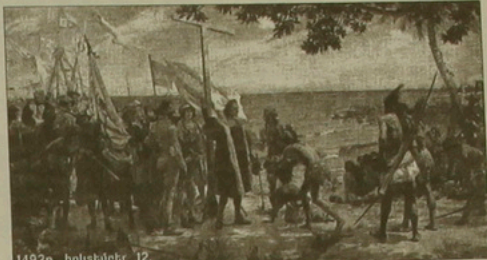
1492թ. հոկտեմբեր 12.

Համեզ նվիրված Ամերիկայի հայտնագործման 500-ամյակին