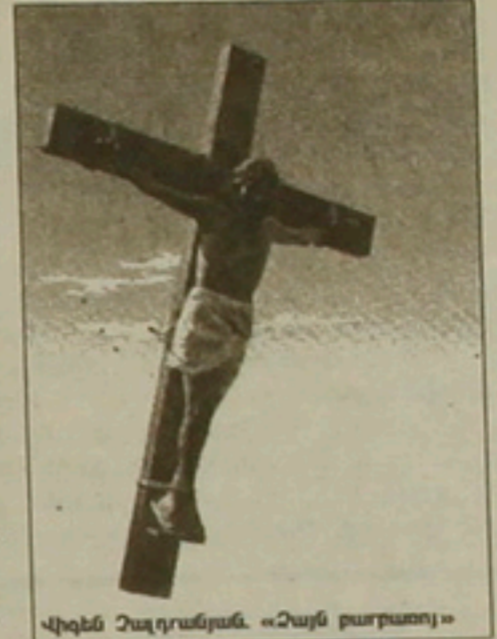
Վիգեն Չալոբանյան. «Չայն բարբառոյ»

դերասանուհի Նորա Արմանին, որը դաստիարակված ներկայացնում էր Հայաստանի մեակույթի նախարարությունը և կինոփառատոնը: Նրանց ջանքերով առաջին դասակարգի լին գովազդները (որոնց էսֆիզները կասա-