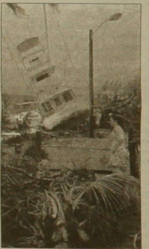
Ամփոփվում են մայրաքաղաք Մ. Նահանգների հարավ-արեւմտյան ծովափնյա բնակավայրում հարվածած «Ընդդիմություն» դրսևառնողի դրսևառնած ավերածությունների արդյունքները: Հասկաղես Լուիզիանայի և Ֆլորիդայի (Մայամի) բնակավայրում ու Բահամյան կղզիներում ծամում 164 մղոն արագությամբ դրսևառնողը դրսևառնել է 20 միլիարդ դոլարի վնաս: 28 հոգի զոհվել են: Լուիզիանայում տայնվել է մեկ հողի, 44 հազար մարդ մնացել է անտուն, վնասվել է 300 հազար քնակարան և ձեռնարկություն: Բահամյան կղզիներում կա 4, իսկ Ֆլորիդայում 22 սղանված, 63 հազար ավերված տուն, 3 միլիոն քնակարան և ձեռնարկություն մնացել է առանց էլեկտրական հոսանքի: Պրսևառնողը, որին ամերիկյան մամուլը կոչել է Մեծ հարված, սկսվել էր Աֆրիկայի արեւմտյան բնակավայրից: