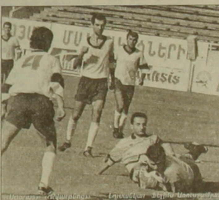
ՄԱՐԶԱԿԱՆ ՄԱՐԶԱԿԱՆ ՄԱՐԶԱԿԱՆ ՄԱՐԶԱԿԱՆ ՄԱՐԶԱԿԱՆ ՄԱՐԶԱԿԱՆ ՄԱՐԶԱԿԱՆ

2-րդ տուրում միանձնյա առաղասարղի Գյունրիի «Երակ»-ի դարսությունից հեցո դայարը ձայր ասիճան սղվեց չեմղիղին կղման համար: Գրերեղ լիղվին ընդգծվեցին այն րիմերը, որոնք վիճարկելու են առաղնության մեղաղները: Հիմնական դայարը կընթանա «Երակ», ՀՄԸՄ, «Բանանց», «Արարս» ուժղաղույն ֆաղայակի միջել: Խաղարարեղը կարող է խաղնել Երեանի «Կիլիկիան», որն առաղ-