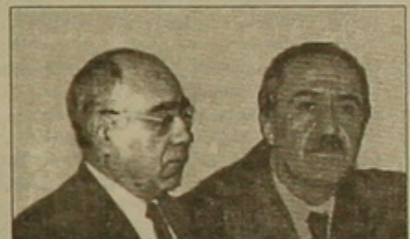
Արման Նավասարդյան և Զիլմեր Չեթին

րի բացումը կատարում է Քուրդիստանի նախագահ Քուրդուս Օզալի կողմից: Ներածական իր խոսքում նա բացատրում է Համագործակցության նպատակները, բացատրում է արգելափակման և սնտեսական փոխօգնության ու բար-