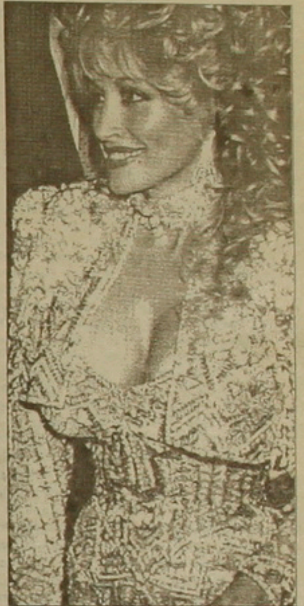
Ամերիկյան երգչուհի Լեյլա Սոմերը

Գիտնականներն առայժմ կասկածում են, թե կանանց կրծքերն արհեստական մեծացնող սիլիկոնը կարող է առաջ բերել անգամ ֆաղցկեղ: Ներկայումս Ամերիկայում 1 միլիոնից ավելի կանայք սիլիկոն են օգտագործել: Մոտավորապես 45000-ը դիմել են քեզիկ օգնությանը՝ տարբեր զանգվածներով: Մյուս կողմից, ամերիկյան Dowcorning Ֆիրմայի աշխատակիցները, որոնք վերջին տարիներին մեծ համբավ էին ձեռք բերել խիստ բնականացնող ամերիկյան նախարարության այս «ժամանակավոր արգելք»ը, դիմում են, թե իրենք կարող են աղափոխել սիլիկոնի ան-