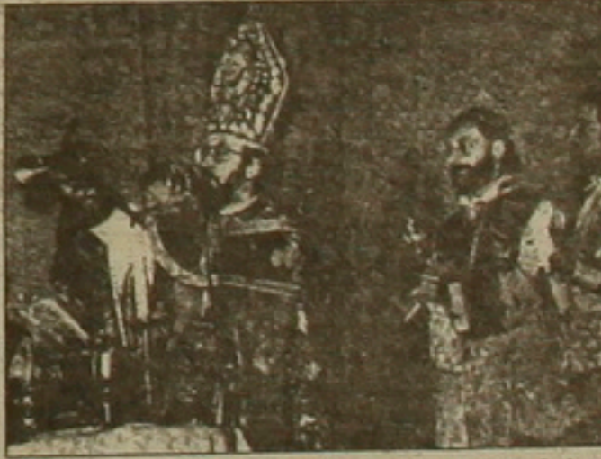
Նյու Զորի Ա. Վարդան ելեղեղում Չորհունի տնականաբար ժամանակ: Առաջնորդ ղաղակաղ եղա, ղարսային կղողին Ամերիկայում Հայաստանի լիագոր ներկայացուցիչ Ալիկ Արզումանյանը ակաղ սարկաղաղ ղեկաղան: