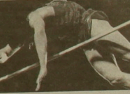
Սերգեյ Բուրկանը զոհված է

Չողացակի աբխազի չեմպիոն ու ռեկորդակիր Սերգեյ Բուրկան բարսելոնյան օլիմպիադայում «ստալավելուց» հետո մարզական շարժումը հանդես եկավ Իսպիայի Պարոյա ֆադալում սեղի ունեցած թեթևասլեսիկական միջազգային մրցաբարում, որտեղ ոչ միայն 42 սանիմետրով առաջացավ 2-րդ տեղը գրաված Իգոր Պոստոլոպիցի (Ալմ-Աթա), այլև, հավասարի մնալով իր սկզբուններին, աբխազի հերթական ռեկորդն ավելացրեց մեկ սանիմետրով: Այն այժմ հավասար է 612 սմ-ի: