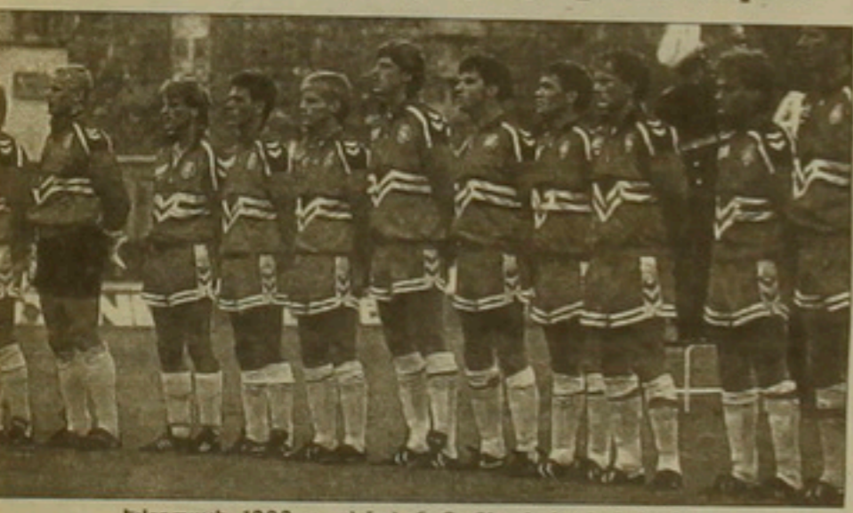
Եվրոպայի 1992 թ. չեմպիոն Դանիայի հավաքականը

Եստույն մնաց Եւրոպայի Ֆուտբոլի Գ-րդ առաջնության անչափ ուժեղագույն, դրամասնակ մրցամարտերը: Այժմ միայն ավստրալիական կարելի է հիշել դրա մասին, չէ՛ որ մեր այս մոսայ, անչափ ծանր եւ համեմատելի օսկով կյանքում նման տներն այնքան ցանկալի են դարձել: Բուն առաջնության ընթացքի, առանձին թիմերի ու խաղերի մասին ասել է գրվել ու խոսվել: Չլրկնվելու համար կուզենայի ուժեղությունս քեռեռել երկրորդ ուղան մղված երեւոյթների վրա: