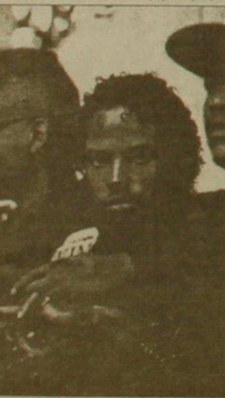
Քրիփսները եւ րադոսները հաճախ-չված ուղեւոր դաշինք

Իրականում այս սարվա խոտկության հեղինակները Լուս Անջելեսում համահաս լե-րիփսների եւ րադոսների հան-ցախմբերն էին: Երբ նրանց