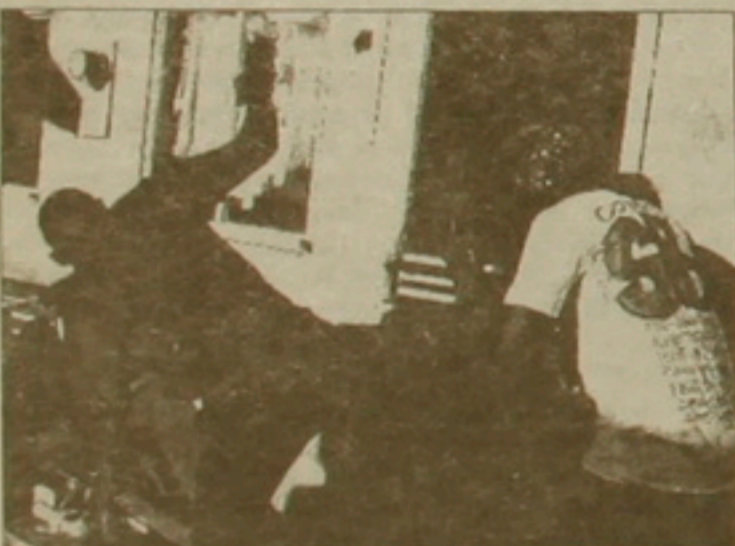
Քրիփսների գլեբրված «առաջնություններից» մեկը

ները դասաղանող հանցախմբերի քախումների հետեւանով զոհվել է մոտ 800 մարդ, որոնցից ամենա-վազը հազիվ 25 սարեկան էր, իսկ ամենակրտսերը՝ 11: Ավճուհաներով կամ խոտը սրամաչափի ասրմա-նակներով զինված 14-ամյա զանգու-սերներն ամեն գիշեր «առաջնու-րյուն» են ձեռնարկում, որը հաջո-ղության դեղում իրենց մեծ համ-րալի կարծանացի: Գողացված եւ լույսերը հանգցրած մեքենաներով նրանք ուղեւորվում են թեւամի հրո-սակախմբի անդամների գրաղեց-րած սներից մեկի կողմը: Մտեճում են եւ կրակ քաղում ավճուհա զե-նից՝ նղասակ ունեւալով սղառել հնարավորին չափ Եաս թեւամինե-րի: Այդ գործում դժվարություններ