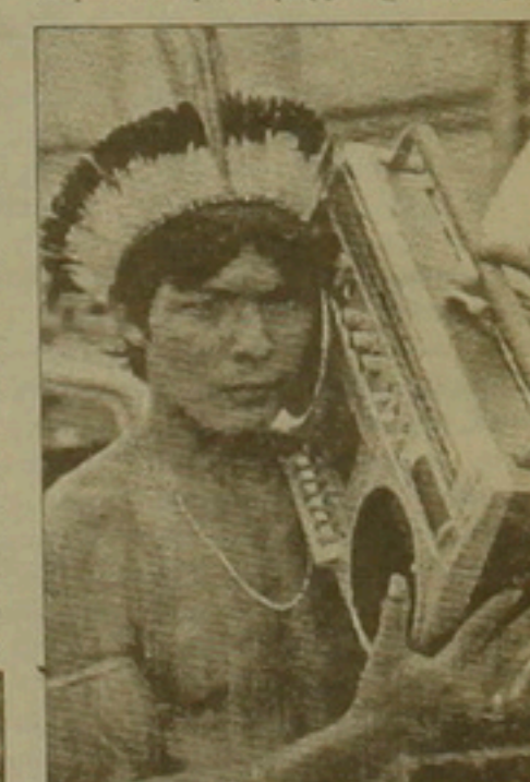
Կայադո ցեղի հնդկացի, հավերժական հարց ինչո՞ւնս հաշեցնել ակտիվաճումն ու ժամանակակիցը:

Օսսավան ընդունել է «Նունավուսի» սահմանագծումը, իսկ Կանադայի սահմանադրությունը 1982 թվականից ծանաչում է «բնիկ ժողովուրդների ժառանգական իրավունքները»: Բրազիլիայի նախագահ Զեմանդո Կոլորը վերջերս