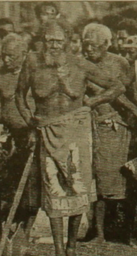
Պապուաներ, սրանց տարածքը Լոր Գվինեան, բաժանված է Ինդոնեզիայի եւ անկախ Պապուանի միջև:

Մեքսիկայի հնդկացիները վերջերս Ավստրալիա մեկնեցին դահլանելու աղանջների կայր Մոնթեսումայի փետրագաղթ քաղաք, որը դահլանում է Վիննայի բանկարաններից մեկում: Կանադայում լեռնից ասիականները ինֆիլտրանություն են դահլանում Բվերբեկի մեկ երրորդում, մինչդեռ էսկիմոսները մտադիր են «Նունավուս» («մեր հողը») երկիրն ստեղծել իյուսիսային տարածքների կեսի վրա: Դա երկրներ սկսում են այս կամ այն ձևով հարգել ինֆորմեման այդ սկզբունքը: