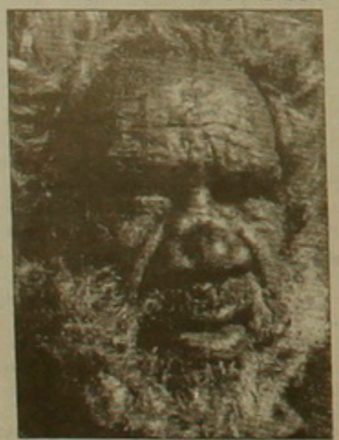
Ավստրալական արորիզեն, սրանց կործանում է ակտիվաճողությունը:

Բրազիլիայում հինգ միլիոն հնդկացի կար հինգ դար առաջ: Ներկայումս դասեմադեա նրանց թիվը 200 հազար է: Նրանք բնաջնջվել