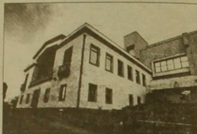
Կառավարական հյուրանոց «Հրազդան 2»