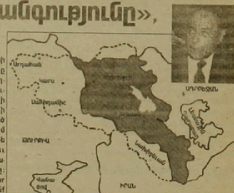
Հայաստանը Արեւելի դայանագրով

Ալիեւը անդրադարձավ նաեւ Դարաբաղյան կոնֆլիկտի խաղաղ կարգավորման այն ծրագրին, որը նախատեսում է սարածային փոխզեղումների հիման վրա երկու սարբեր միջանցների սեղծում, ինչոպես Լեոնային Դարաբաղի ու Հայաստանի, այնոպես էլ Եւրոպայի ու Աղբյուրի միջեւ եւ արսահայեց բացասական վերաբերումն, դասճառաբանելով այն հեծելալ կերպ. «Չճայած հաղորդակցական ուղղակի կաղի բացակայությանը, Եւրոպայից Աղբյուրի բաղակցուցիչ մասն է: Աղբյուրից էլ է դասակարգում նաեւ Դարաբաղը: Դարաբաղի ու Հայաստանի միջեւ միջանցի սեղծումն ինքնին Հայաստանի ընդունել, որ սարածը Հայաստանին է դասակարգում: Ծրագիրն այդ առումով անընդունելի է»: