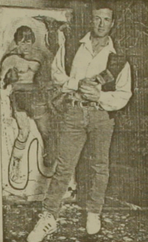
Գալորմեն են, հոգու գողեր:

Ինչպես բոլորը: Երբ վախենում եմ, գոյախ առաջ եմ խորում: Երբեք ցգվում, մնում եմ: Ֆիզիկապես ոչ ոքից չեմ վախենում: Ֆիզիկական վախերը միշտ հարթահարթի են: Ավերիչը գոյացրեց, հազար կան վախն է, այն կարվածահար է անում ինչպես դերասանը, կասկածը: Ես երկար ժամանակ կարծում էի, քեզ բոլորն էլ իմ լավն են ցանկանում: Ինչքան միամիտ էի: Ես սովորեցի լինել ցինիկ, գոյա: Աննից չեմ ասարսփում եմ այն մարդկանցից, որոնք եմ վրա իշխանություն ունեն, քանի որ գիտեմ այնուհետի քանի, որ չեմ ուզում բոլորն իմանալ: Բոլորն էլ սպիտակ կողմ ունեն: Ընտանիքները համ-