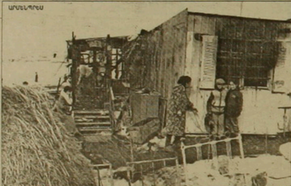
Արթիկ, ավերվել է 75 բնակարան

Ինչոյն հաղորդեցին Ռուսաստանի արգործնախարարությունում, Ա. Կոզիրեւի և Չ. Բեյբերի միջև տեղի կունենա երկկողմանի բանակցությունների մոր փուլ, կաղված առաջին հերթին սրտաւեգիական հարձակողական սղոտագիւրությունների կրճատման նոր դայոնաւարի մեւակման հետ: Նախասւավում է, որ այն կստորագրվի հունիսի կեսերին Բ. Երցիմի ԱՄՆ կատարելից այցի ժամանակ: Նրանց միջև մարտի 11-ին Բեյբերի կայացած բանակցությունները ի հայտ էին քնել կրճատող սղոտագիւրությունների ժամկետների և սեւակների հետ կաղված որոտարւմայնություններ: