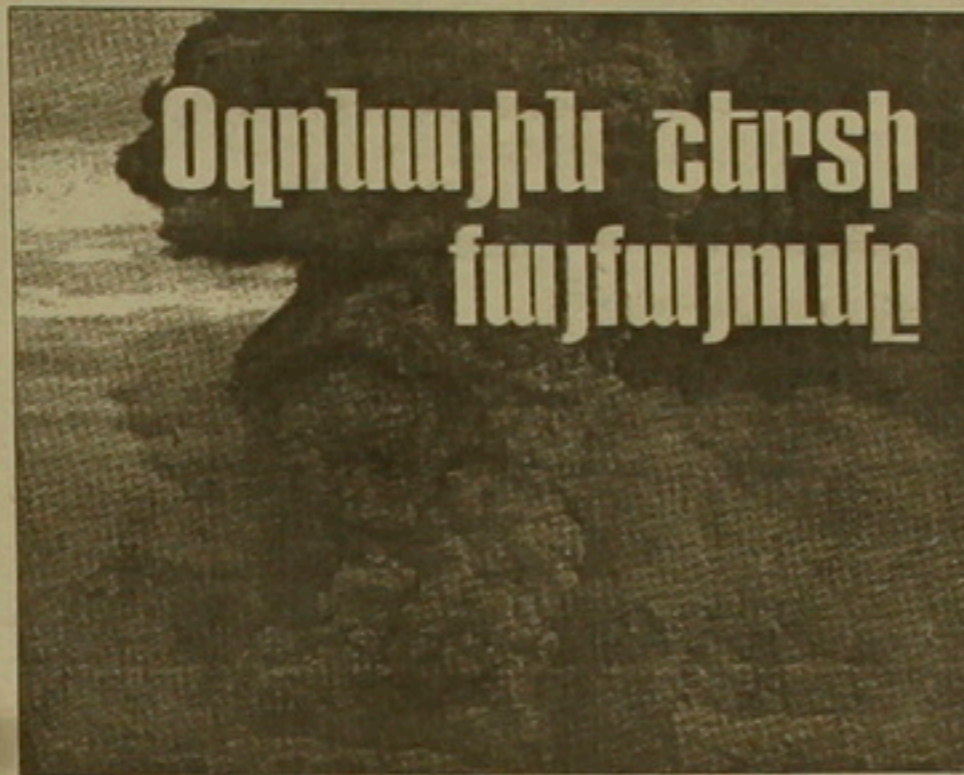
Պիտանուրի հրաբխի ժայթքումը 1991-ի հունիսին. միլիոնավոր տոննա փոփ արանեձեւեց երկինք, արագացնելով օգոնի Բայրայունը:

նադեպ հաստատեցին, Բայր այդ Եւրոի վրա մի «անց» էր քացվել Հարավային քեւեռում Անարկիկայի վերելում: Աբխարիի մի Եւրո դեկուրյուններ անմիջադեպ արձագանեցին դրան, նեւելով, որ անհատադ միջոցառումներ դեկտ է ձեռք առնվեն դրա առաջն առնելու համար: 1987-ին Մոնրեալում նրանք ստուարեցին մի դայրանագիր, որով կոչ էր արվում մինչև 1999 Բվականը կիսով չափ նվազեցնել Բուրաձյուրակարթնային արտարությունները: Երեւ Տարի անց, հաւելի առնելով, որ օգոնային Եւրո Եւրո ավելի արագ Բայրվում է անհետանում, աբխարիի Եւրոի կողմերից եկած դաշտանիչությունները դարձյալ հանդիմոցեցին, այս անգամ Լոնդոնում, և որեւեցին մինչև 2000