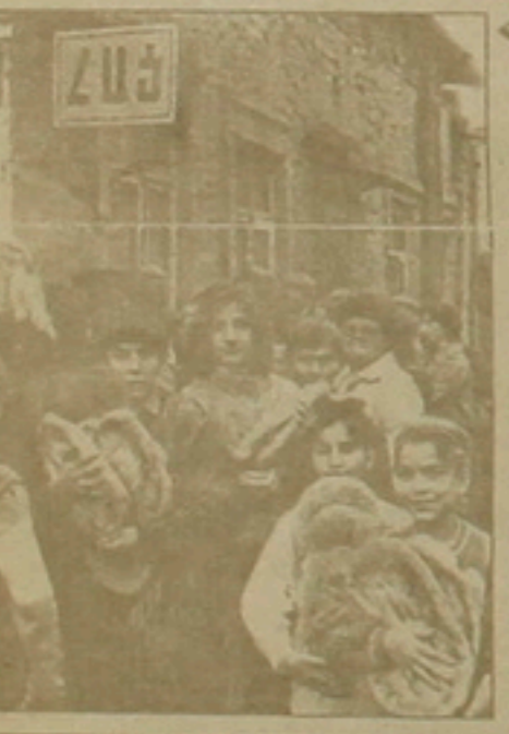
Թուրքիան անարբեր չի մնա

Այն կամ այն հարցում ղեկա-կան ֆաղափարություն, ղեկավար ձեռնարկումների մասին հաճախ լսում ենք օտարից, որից, մի քան ավելացրած քե ղեկավարները չգի-տեն: Թուրական մամուլից տեղեկա-նում ենք քուրի-հայ հարաբերություն-ների ճգնաժամների, մանրամասների մասին: Եվ արած՝ հարցնում ենք «մերոնք», կամ տեղյակ չեն, կամ մտնում են, կամ էլ արգելված է անել: Մինչդեռ նրանք աղմուկադա-ղակ են քարծրացնում, ֆրեում ի-րենց մեծամեծների յուրաքանչյուր խոսելը, դաշնակցության կան-խում: Չեն կարծում, քե քուրական քերթերն այս ամենն անում են հա-նուն հայերի: Պարզապես դա է