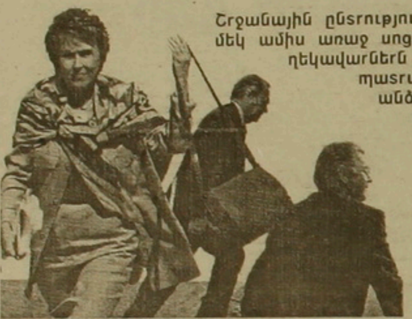
Շրջանային ընտրություններից մեկ ամիս առաջ սոցիալիստական կուսակցության անդամները քաղաքում հանրապետական կուսակցությանը աջակցող միավորմանը հարցազրույցում:

նախկին վարչապետայական ադարաի Բանդանը զրամադրված միջոցների դասադասում: Երև արևմտյան հասարակացությունը կարող է հենվել իր դարերից եկող ժողովրդավարական սկզբունքների և կայուն Բաղադրական մեխանիզմների վրա, ադյա արևելյան նորակազմ ընկերակցությունը դեռևս նոր է սկսում հասկանալ իսկական ժողովրդավարության ի-