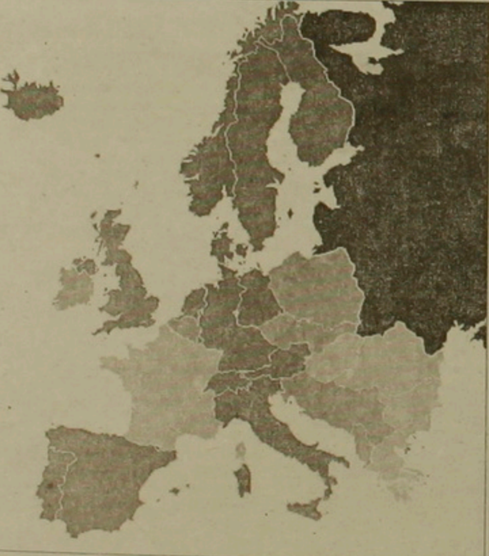
Արևմտյան Եվրոպայի ժողովրդագրական փառաբանության փառեցը