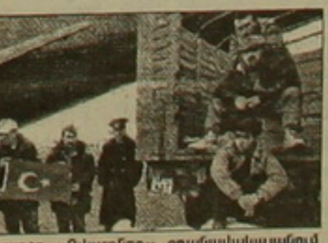
Թուրիական դրոշը «Ազլարթոն» օդանավակայանում