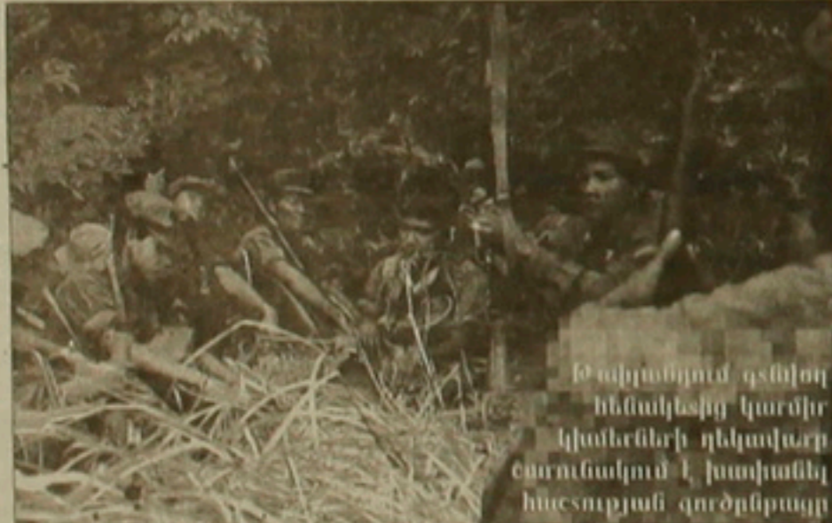
Թափանցիկ գեղատեսիլ կամրոզի կլաններն իրենց կարգավիճակը...