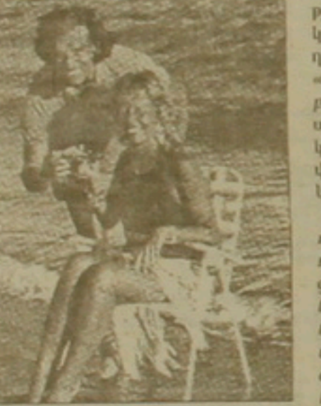
Ռոդալգալ Զարդել արհմիութենական ամենակարող և մաճիական իբխանության ողնաբար: Նա վերջ սվեց նաև իր նախորդների ոչ կործանողական ֆալսիֆիկացումը, լախիստներկյան միակ երկիր լինելով: Երջի դաշտայնությունը կրկին երևեց Զրեգաս, ինչը նրան «Միացյալ Նահանգների լալագույն բարեկամը» դարձրեց աբխասիանա: Եւ վերջապետ, նա ձեռք գարկեց լայն սեփականաբանում վրա հենվող ճնշական ազատական ֆալսիֆիկացումը:

1989 թ. հուլիսին իբխանության գրուս անցնելուց հետո Արգենտինայի նախագահ Կարոս Մենենդեզը կա-