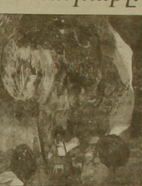
Նոր, արձանագործ Ա. Մասվեեր-եւ ուրիշներ: «Գործարար տոգ»-ի այս ցուցահանդեսները չունենի ոչ կոչման, ոչ էլ գեղագիտական կրկերես ծրագիր: Դրանք ներկայացնում էին ցուցադրվող երեսասարդ նկարչների...