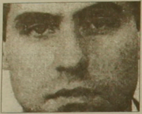
Յրանսիայում ՊԱԿ-ի նոր ցանցի բացահայտումը ցույց է տալիս այդ երկրի պաշտպանական համակարգերի թերի կողմերը

կանոն լինելով ՊԱԿ-ի ստա: Գրանից հետո դարձեալսվել է խորհրդային ամենաբարձր ասյանների կողմից և դարձել Ռուսաստանի լրեսեսական հասուկ դրոյցի ամբիոնի վարիչ: ԽՍՀՄ դետայանասանը մեակուրային հարցերի փոխարեն նա գրադվում էր Յրանսիայում գիսական տեղեկությունների հավաճմամբ, կիրառելով դարդ ու արդյունավետ նոր մեթոդներ: Նա մամուլի ազդերին հետեւելով՝