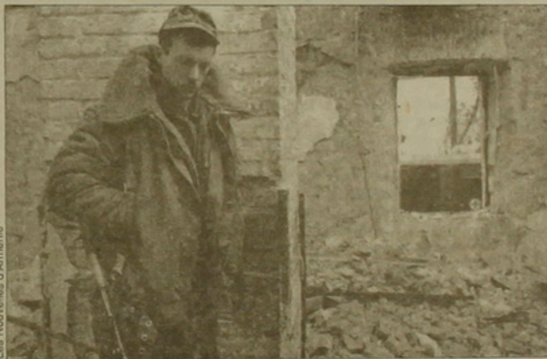
ԱԳՊ բանակի ռուս զինվորը Սեփականների ավերակների առջև:

Կառավարության եւ երկրի կուրսի փոխվելը, ճրա մասնատումը «ազատ, անկախ» դեմությունների, ինչպես տեսնում եմ, կատարվեց թավակներին դուրսից: Ավելի դժվար էր ժողովրդի հարցը, սակայն