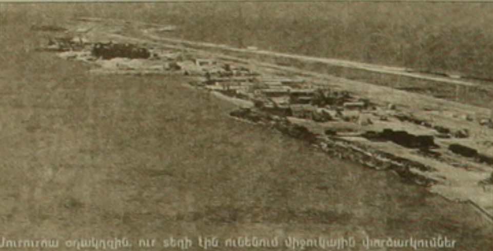
Մուրուրա օդակղզին, ուր տեղի էին ունենում միջուկային փորձարկումներ

Սառը դաստիարակման անձնի համար չի ավարտվել: Սպիտակ նա շարժումնակ է նոր գործի դասձառ դասնակ: Բանգի բոլոր գործող լրսեաները չէ, որ զենքը վայր են դրել: