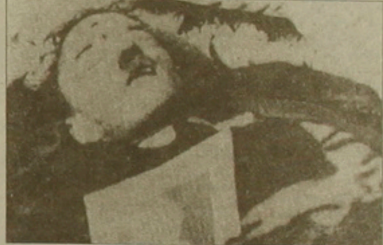
դեպոնանսան մասնակցի ֆարսուղարը, որ ճանաչում էր Հիշելին, մեկնելով Բեռլին հաստատել էր, որ ֆիլմում նկարահանված աշուկը Հիշելին չի տեսնում: Այս տեղեկությունը հաստատեց, երբ ասանաբար Բեռլինյան են քարկել:

Ուս դասարան Լեւ Բեգիմենցին հայտնեց, թե Գերմանիայի բնակալ Ա. դոլի Հիշելի ածխացած աշուկները գտնվել էին 1945-ին, երբ խորհրդային զորքերը Բեռլին էին մտել: Հիշելի կզակն ու զանգի որո մասեր գտնվում են Մոսկվայի արխիվներում: