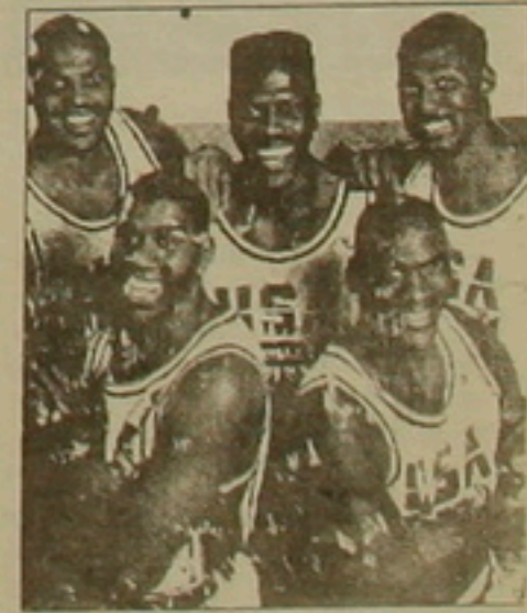
Վերին շարքում ծախից ալ Չարլզ Բարկլի, Պասրիկ Էլիմի, Կարլ Մալուու: Երեսն ասում «Սեղիկ» Չոնսոնը: Կարլ Չոլոյը:

Սոխի վիրտուալի անվանի բասկետբոլիսը դարձել է այդ հիվանդության դեմ թայբարի գլխավոր խորհրդանիշը: Ամբողջ աշխարհում: «Սեղիկ» Չոնսոնը մտադիր է իր ընկերների աշխարհի լավագոյն բասկետբոլիսներ Չարլզ Բարկլիի, Պասրիկ Էլիմի, Կարլ Մալուուի եւ Մալի Չոլոյի հետ հանդես գալ բարեկրթյան օլիմպիադայում: