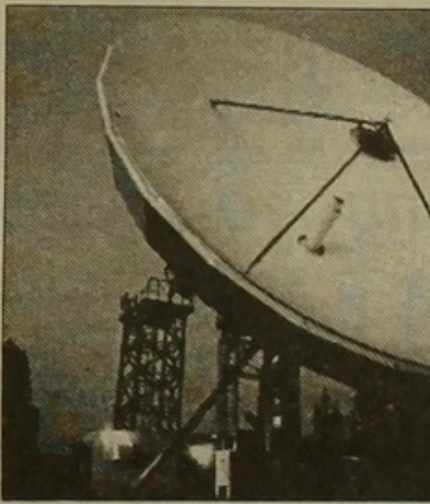
Մեր տեղական քրքակցներ Բոստոն, Երեւան, հոկտեմբերի 24, 1991

րոճանիցը: Այնուհետեւ հյուրերն ուղեւորվեցին ժամոթանալու Ջրվեժում տեղակայված արբանյակային կայանին: Կաղի նախարար Ռոբերտ Ավոյանը մեր քրքակցին սասց, որ այս ծագրի իրագործումը հնարաւորություն է տալիս Հայաստանին 7 սասնայակով ոսջոն կասարել: Ծախալել է մոտ 6 միլիոն դոլար, որից 4 միլիոնը վճարել է ամերիկյան կողմը, իսկ 2 միլիոնը՝ հայկականը: Այժմ AT&T-ի մասնագետները հետ աւխասան է տարվում փոխելու նաեւ Երեւանի հեռախոսային ցանցը եւ աւելի մեծացնելու միջազգային հեռախոսակաղը: Առաջիկա ծագրերի մեջ է մտնում Փարիզի հետ համատեղ հեռախոսակաղի ստեղծումը: Հայաստանն առաջին հանրապետությունն է, որ ԱՄՆ-ի հետ արդեն իսկ ունի 180 առանձին հեռախոսային ուղիներ, այն դեղում, երբ Մոսկվայում կա ընդամենը 64-ը: Այսպիսով, հայաստանցիներն արդեն կարող են առանց Մոսկվայի միջադաւալին կաղի ծառայության միանգամից զանգահարել ոչ միայն ԱՄՆ, այլեւ Արեւմտյան կիսագնդի այլ երկրներ: Ծագրվում է, որ Երեւանը կունեն 470 հեռախոսաղիներ՝ 5000 արոններով: Հեռախոսակաղի մեկ տղեն կարծեւ 12-15 ուրլի կամ 3 դոլար: