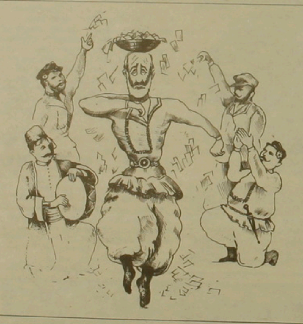
Տարցակարգ՝ Սարցիսյան ԲՈՒՄՍՍԱ

Ինչդեծ հարողում է Վրաստանի նարագահի մամլո ծաոայտրքյունը, նսաււրջանի օրակարգում միայն մեկ հարց է Թբիլիսիում հասարակական-քաղաքական իրավիճակը խաղաղ կարգավորելու ուղիների որոնումը»: Ըստ հարողդարտրքյան, լարագածավորները հայտարարտրքյանը դիեցին քաղաքացիներին կոչ անելով «դարսախանսակտրքյան գգացում դրսեւորել եւ եոնդրահ մնալ որեւէ քոնի գործողտրքյուներից»: Վրաստանի նախագահի մամլո աոայտրքյունը նեցց, որ «Գերագույն խորդի քողար ճրակցիաները դարսասակարտրքյուն են հայտնում անել ամեն ինչ ըստեղծված իրավիճակի լարվածտրքյունը քուսցնելու եւ ազգային հաւատրքյան հասնեւ համար»: