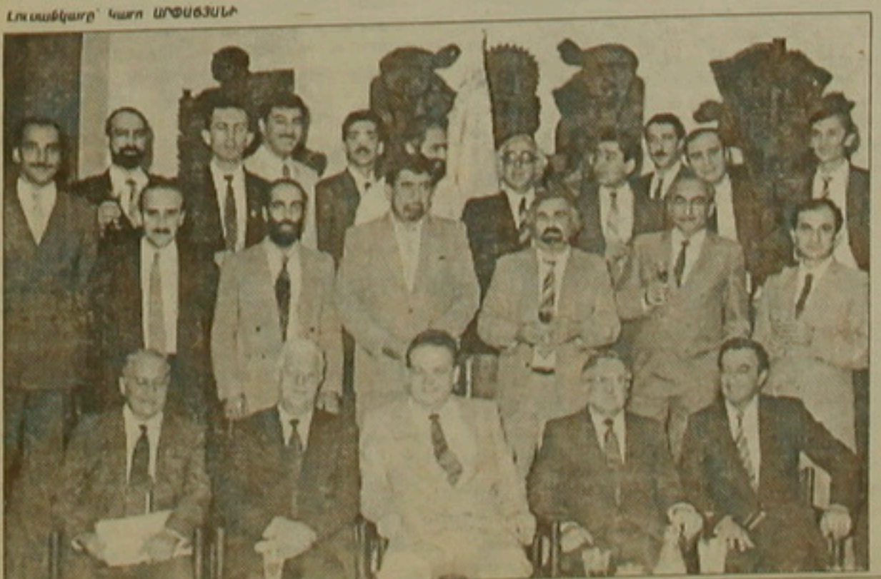
Լուսինյանը՝ կարն ԱՐՄԵԼ ԳՐԵՍԻ

Վիղեն Խաղայան (ՀՌԱԿ հիմնաղիղ խորղիղի անղամ, Հայաստանի խորղղարա- նի ղազաղմաղոր).- Ես կարծում եմ, որ ներ- կաները մեծ սղաղղություն սակ են, մի ան- գամ եւս համղղվելով, որ ՌԱԿ-ը հաղասա- ղիմ է մոնո իր սկզբումներին, եւ նրա ներ- կայղությունը Հայաստանում վկայում է գործը: Անկասկած, այս ձեռնարղը եւսաղիղ կղաղ- նա արտաին սնեստական կաղերի եւ Հայաս- տանում ձեռնեղեղության զարգացմանը: Ես ներկաների հայաղղներին, կեցղվածներին եւ խոսներին մեջ սեւա վստաղղություն եւ համղղ մոնք, որ գործերը հաջող կընթանան: