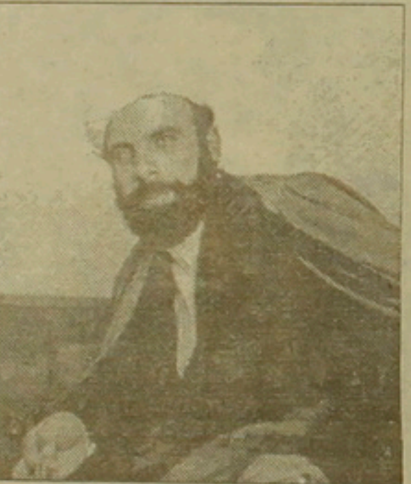
Շեխ Աբդու Քարիմ Օրբեյի

ըր, Միջերկրյան, նրան ձերբակալողները: Ինչպես նախորդ դեղիներում, այս անգամ էլ, ինչ խոսք, առկա էր «գործարք»: Ազատ արձակված ՄակՔարտին ղեկ էր Չիխաղ կազմակերպության կողմից նամակ հասցված ՄԱԿ-ի գլխավոր ֆարսուղար Պերես դե Կուելյարին: Ենթադրվում է, որ նամակում Պատանդները է ազատ արձակել 300 Երջանային Լարային Լիբանանից եւ 75 քանա-սարկային Իսրայելից, այդ թվում նաեւ «հոգեւոր ղեկավար» համարվող Եյիս Արդե Քարիմ Օրբեյին: