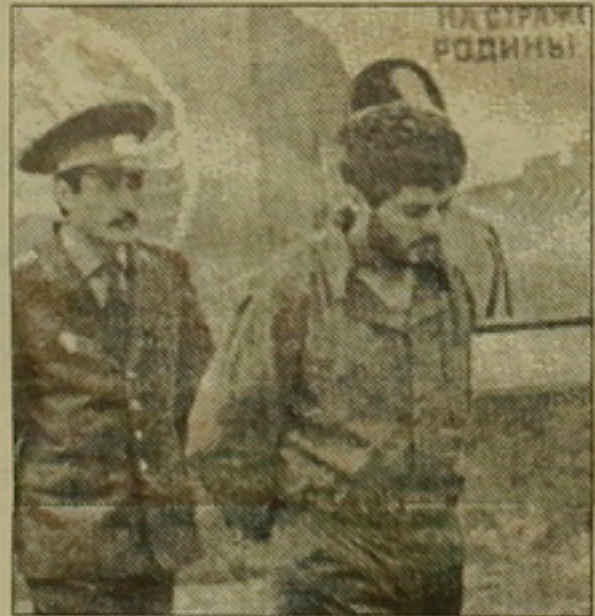
Տնօրնակված «հայ գրողներ» Ղազարյան

Ի տարբերություն Ադրբեջանի տրեզորներին, Ազգային մակասի առաջնորդ եւ հանրադասության Գերագույն խորհրդի նախագահի տեղակալ Թամեղան Կարաբեր