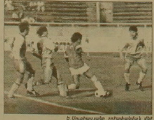
Բ. Սուքիասյանը չրջափակման մեջ

Այդպես կարելի է կորցնել նաև մնացած փոքրաթիվ հանդիսականներին: