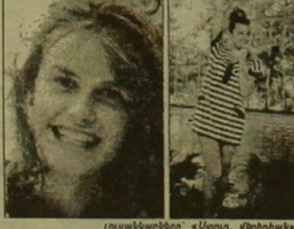
Լուսանկարները «Ստույգ մարդիկ»-ի

Մտն անգամ, երբ Գորբաչովը հաղթահարում է իր դեմ հարույզված որոնց դեմ-վարություն, ստիպված է լինում դիմագրավել հաջորդ խոչընդոտը: Փաստորեն նա շարունակ պատերազմական վիճակում է գտնվում, որի ընթացքում նրա դեմ օգտագործվում են պատկան զենքեր սկսելու արդյունքի միջև և գալիսկոնցույցի լուրերը: Ենպեսիցի վերադառնալուց հետո, պրեզիդենտը դեմ առավ Կոմկուսի աջերի շարժմանը. սրանք նախապատրաստվել էին պահանջել նրա հրաժարականը առաջին քարտուղարի պարտականություններից: Սակայն,