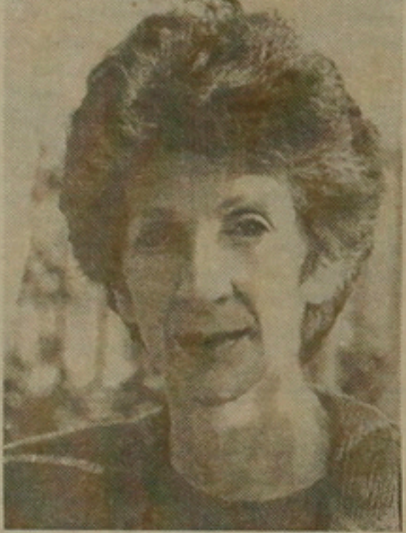
Սփեխարկածստիմ պիտի ըլլա:

Պ. - Մեր եկամտուը կհաշվենք անով, թէ որքան մարդու օգնած ենք, ոչ թէ ինչ գումար շահած ենք: Եթէ 50 հազար դոլար ծախսած ենք երկու հոգիի օգնելու համար, ատիկա բավարար արդյունք մըն է: Բայց եթէ 100 մարդու օգնած ենք այդ նույն գումարով, սա արդեն ավելի արդյունավետ է ապագայի համար: Մեր բուն նպատակը հայերը հայ պահանջն է, բայց նաեւ մենք պիտի ձգտենք, որ հայը ունենա նույն այն մակարդակը, ինչ որ այն երկիրը ունի, որուն մեջ կայիր: Այլ ոչ թէ այն, որ հայ զարգաբեր ունի: Դժբախտաբար, հայկական սրբանդամի չափանիշները դուրսը շատ ցած են: Ամերիկա աստիճանի մարդ կերթա աշխատանքի, եւ ամեն ինչ կընեն, որ հաշտութեան հասնեն: Բայց զիջելու կուգա նույն այդ մարդը հայկական որեւէ գործի մեջ, եւ սրբանդամը կիջնեն, պարփակվելու արդեն պատրաստի զազուրակին կողմապարներու մեջ: Արեւերկրի հայերը շատ կեղտոնացած են ավանդություններու վրա: Ժիշտ է, բաներ կան, որոնք աչքի լույսի պէս պետք է պահել, սակայն ուրիշ բաներ ալ կան, որ-