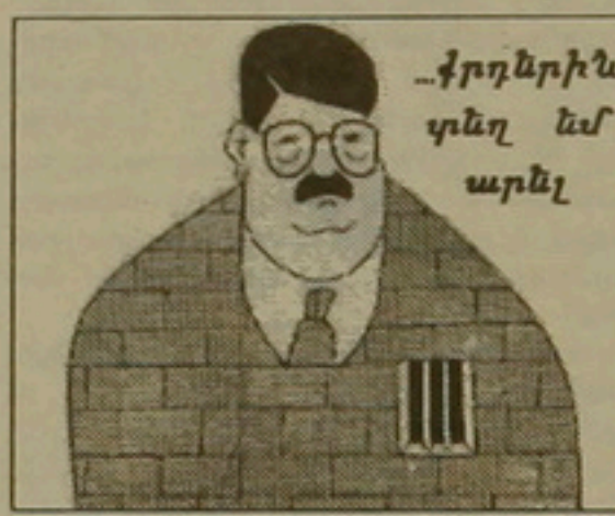
Թուրքական «Կանար» ամսագրի

«ՄԱՒԻՅԵՔ» - ապրիլի 21 Իրարում քրդական գոտու ստեղծման պրեզիդենտ Օզալի առաջարկությունը լայնորեն է քննարկվում բուրքական մամուլում: Հատկապես արտահայտվում են այդ առաջարկության ընդդիմախոսները: Նրանցից է վարչապետ Աբդուլուրը: Նա հայտնել է, թե կողմնակից է Իրաքի հողային անդրազականության պահպանմանը: Այսպիսի տեսակետ է պաշտպանում ընդդիմադիր ճակատի պարագլուխներից Սու-