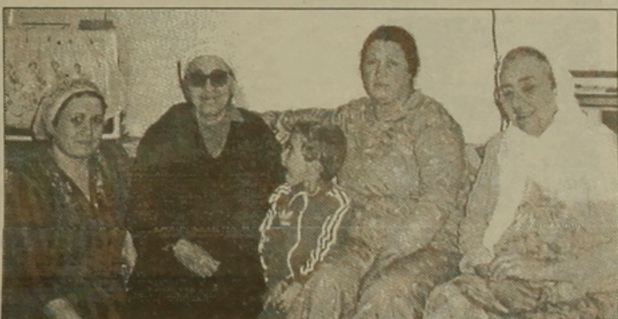
Մարիամի ու Աննայի դուստրերն ու թոռները տարագրության ճամփաներով անցնելով, վերադառնում է տուն՝ քղբին հանձնելու իր տպավորությունները: Նյու Յորքում հրատարակվող Չոմախլու հայրենասիրական ընկերության «Արգենտ» ամսագրում նա տպագրում է մի հոդված՝ Մաանում արված լուսանկարներով և այնտեղ ապրող հայերի լրիվ անվանացանկով:

Տեր-Ներսիսյանը մանրամասն նշում է յուրաքանչյուր խմբում ընդգրկված հայերի քանակը: Մաանում, օրինակ, բացի Չոմախլուից եկած 15 ընտանիքից, հայեր կային նաև Քիլիսից, Բեյլանից և Հոմալկայից: Ուադի Մուսայում 450 գաղթական կար Չոմախլուից: Չոմախլուից ամենամեծ խումբը՝ 750 հոգիանոց, ուղարկվել էր Շոքաք: Ցեխի մեջ կորած, սուլիք ու գանգամ հիվանդություններից տառապող այդ խմբին անգլիացի գիտնական ու գիմկոր Թոմաս Էդուարդ Լուրենսը այսպես է նկարագրել. «Նրանք ուրվականների նման էին: Նրանց վրա նայելն անգամ սարսափազդու էր»: