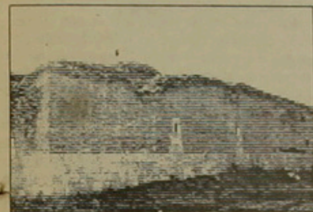
Խոյի ս. Սարգիս եկեղեցին

1968 թ. մի խումբ ուսանողների հետ գիտական արշավի մեկնեցինք Ատրպատական, որտեղ խոյեցի երիտասարդներից տեղեկացանք մի հայկական եկեղեցու մասին, որն իր առանձնահատկություններով գրավեց մեր ուշադրությունը: