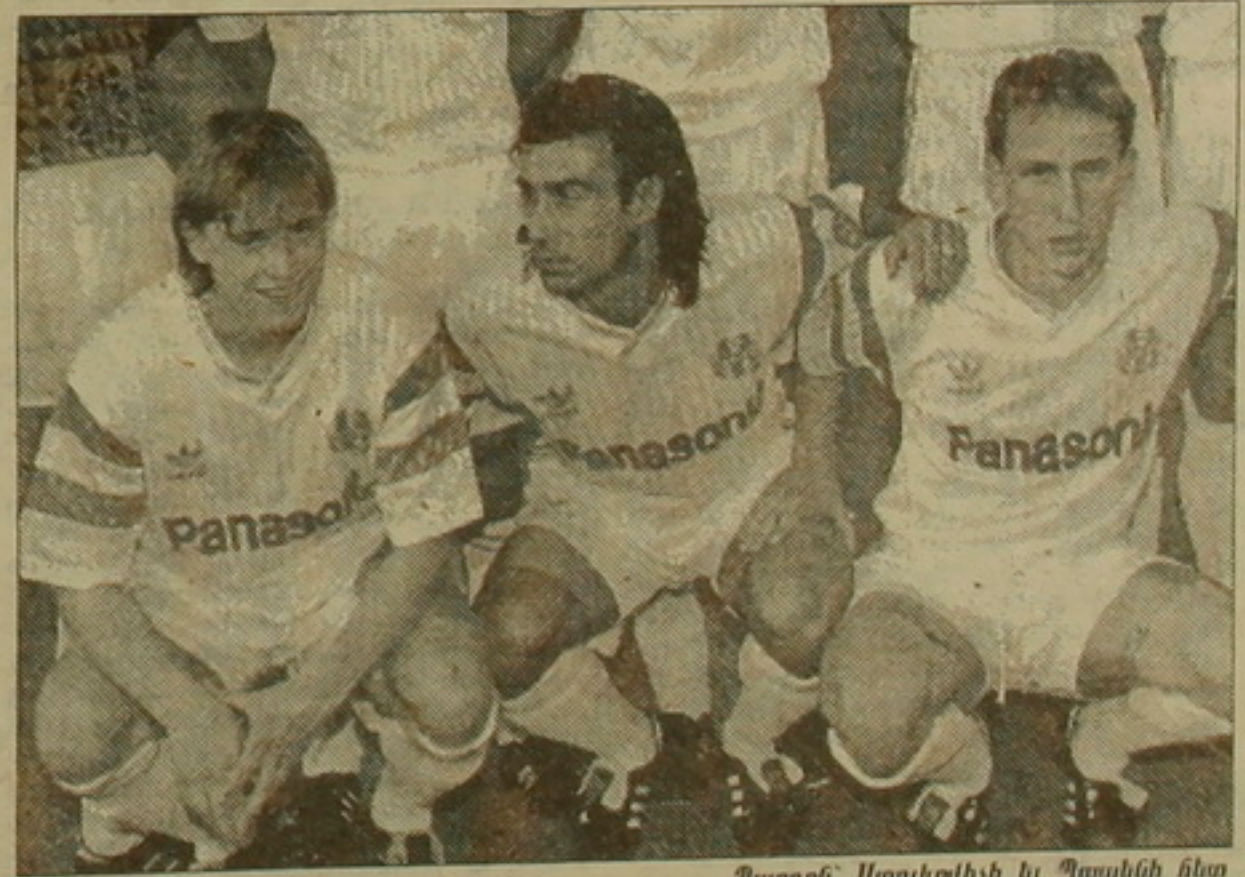
Պարոն՝ Ստեփանիլի եւ Պապենի հետ